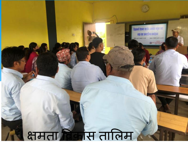
क्षमता विकास तालिम