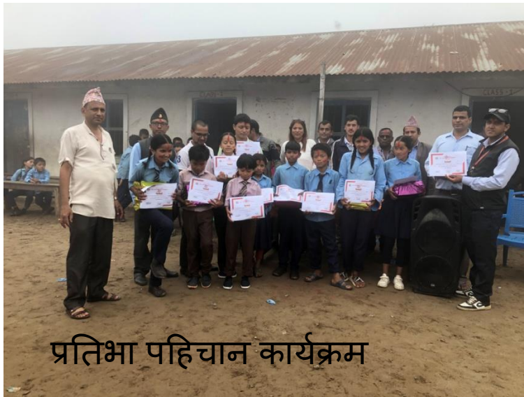
प्रतिभा पहिचान कार्यक्रम