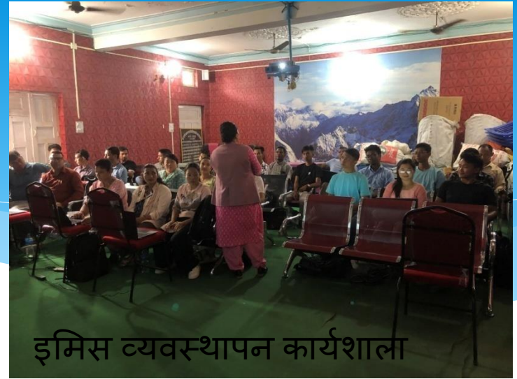
इमिस व्यवस्थापन कार्यशाला